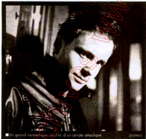
Un grand romantique doublé d'un artiste attachant

L'ECOLE TF1 C'est devant sept à huit millions de personnes chaque samedi